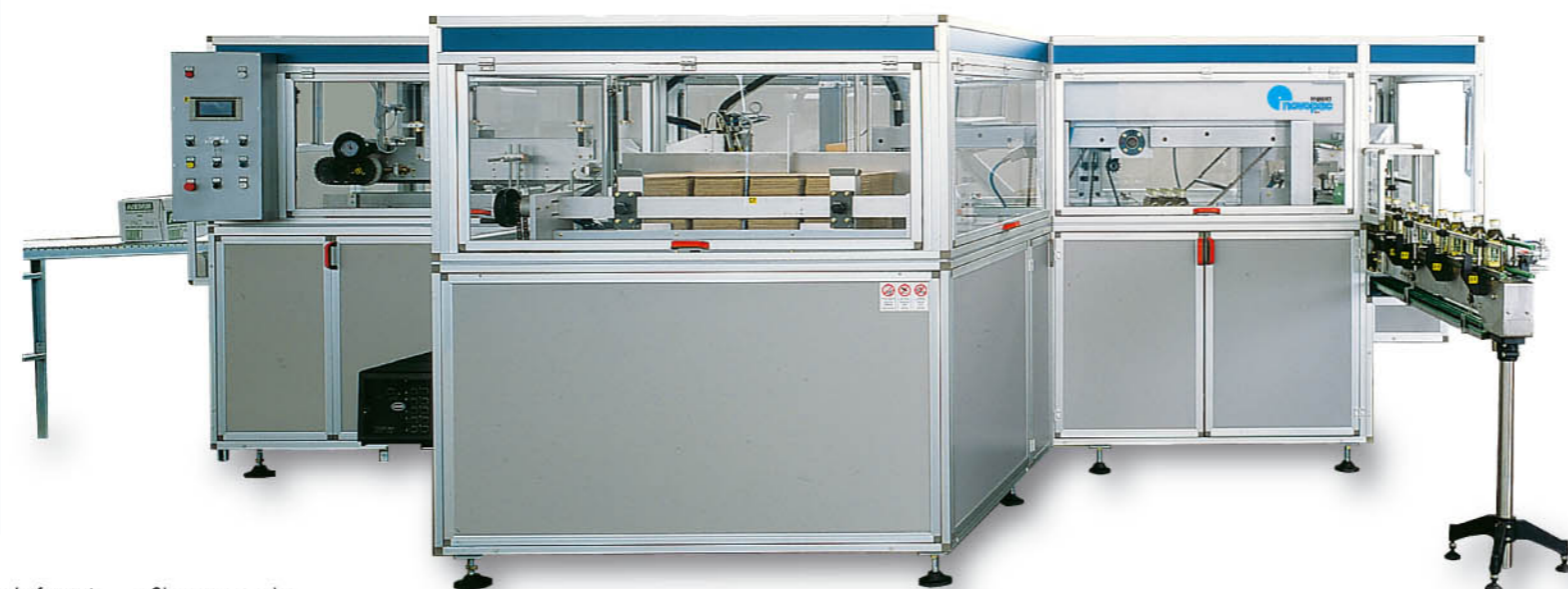
MOD. VF 100 COM