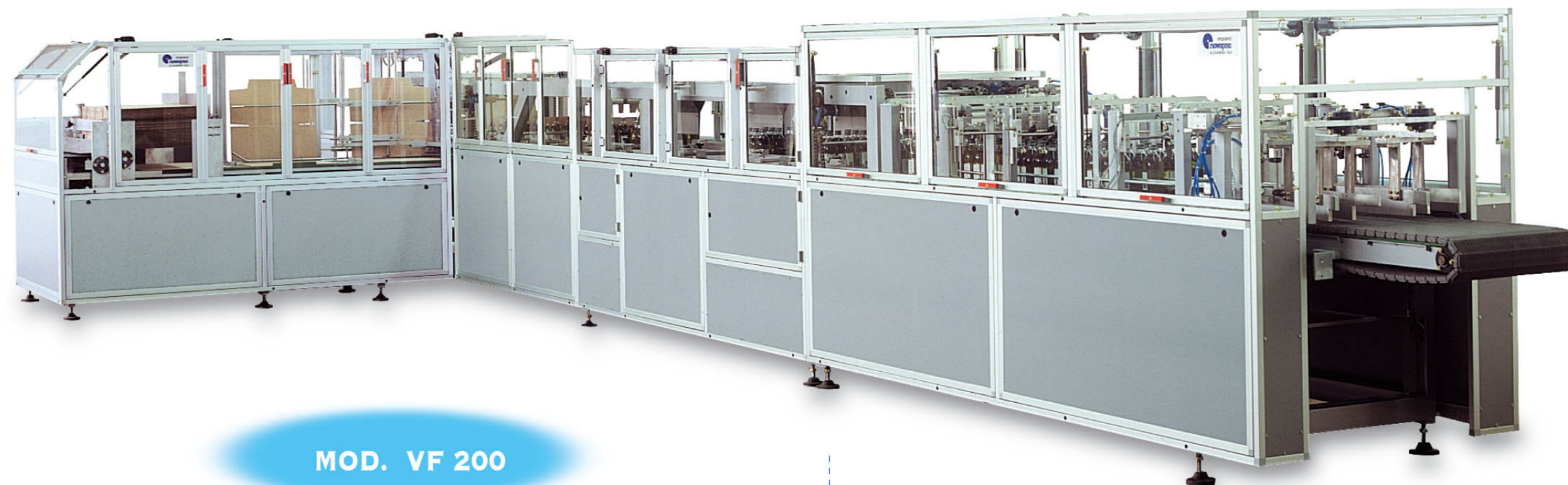
MOD. VF 200

Automatic packing lines for cylindrical square and rectangular products in cardboard tray or carton.